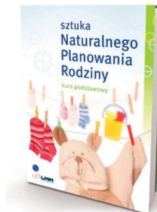
Najnowsza książka Ligi Małżeństwo Małżeństwu. Kupisz tutaj: www.npr.pl/sklep

Warto przy okazji zauważyć, że naturalnego planowania rodziny nie powinno się utożsamiać z dość częstą obecnie praktyką polegającą na obserwowaniu i interpretowaniu cyklu połączonymi ze stosowaniem w okresie płodności antykoncepcyjnych środków barierowych. Taką „metodę mieszaną”, polecaną przez niektórych jako „zdrowa alternatywa dla antykoncepcji hormonalnej”, określa się często skrótem FAM (od angielskiego Fertility Awareness Methods – „metody oparte na świadomości płodności”).